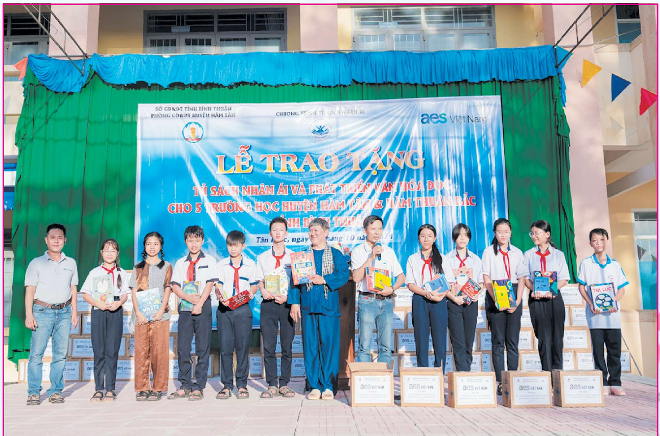
Chương trình "Tủ sách Nhân ái" phối hợp cùng Tập đoàn AES - Chi nhánh tại Việt Nam tổ chức lễ trao tặng Tủ sách nhân ái với chủ đề "Phát triển văn hóa đọc thúc đẩy học tập suốt đời" tại Hàm Tân. Tổng giá trị của 5 tủ sách nhân ái và kệ là 240 triệu do Tập đoàn AES - Chi nhánh tại Việt Nam tài trợ.