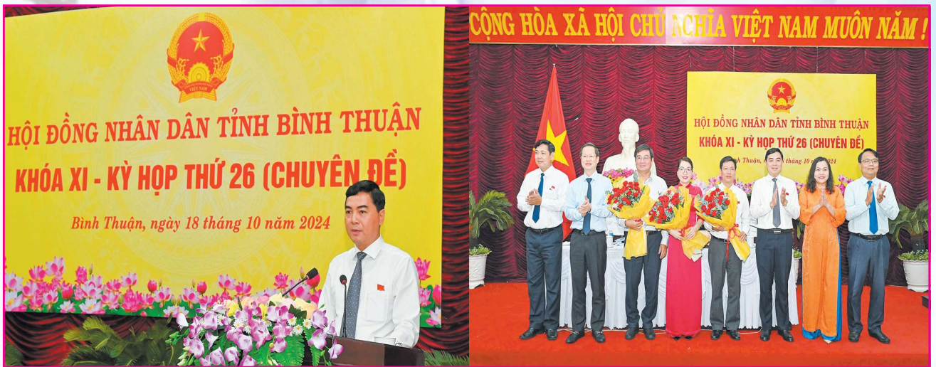
Ngày 18/10, Bế mạc kỳ họp thứ 26- HĐND tỉnh Bình Thuận khóa XI: Thông qua 13 nghị quyết quan trọng trên các lĩnh vực kinh tế, xã hội ...